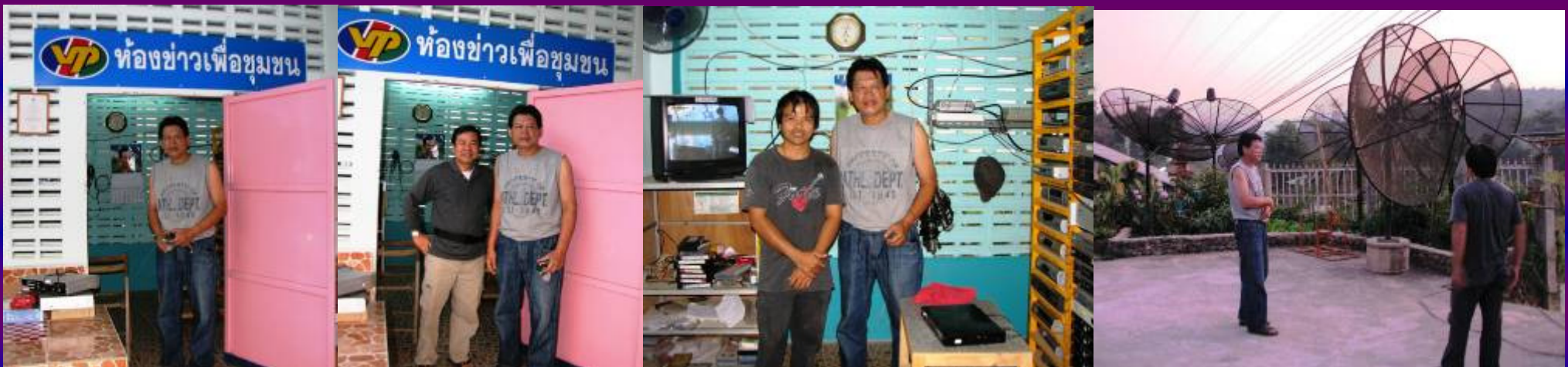
Owner of Cable TV

Do you know how much I have to pay for this program? FREE. But as a token of appreciation I honored him US$ 156 for one year. Please PRAY for ME!